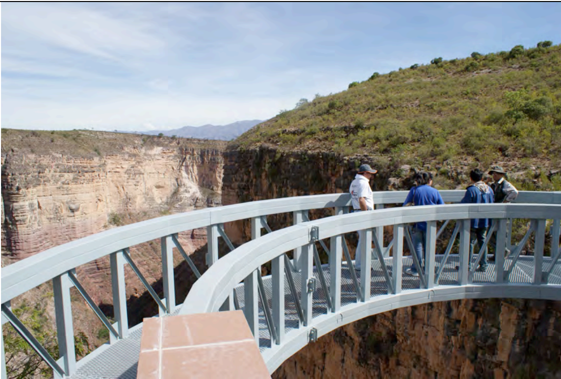
Pie de Foto: El Mirador de Torotoro. Obra construida por Fundación contra el Hambre Bolivia, El Gobierno Municipal de torotoro y el Programa de Naciones Unidas para el Desarrollo.